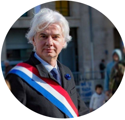
Fabrice LE VIGOUREUX Député de la 1ère circonscription du Calvados